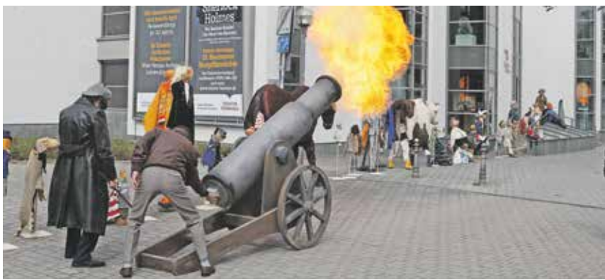
Am 1. Mai fällt der traditionelle Startschuss zum Vorverkauf

immer dienstags, 21.30 Uhr finden im Hof der Ortenburg die 15. Bautzener Burgfilmnächte unter freiem Himmel statt.