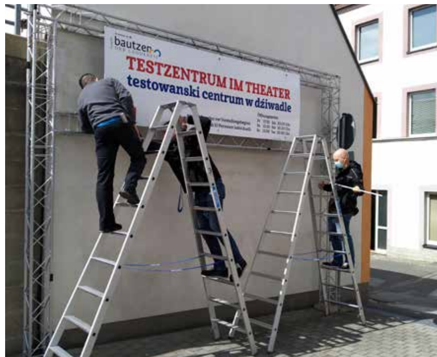
Die Kollegen der Technik brachten große Hinweisschilder auf der Bauerngasse an.