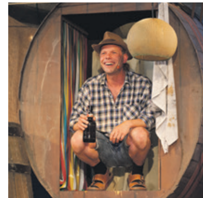
Ein humorvoller Abend mit Puppen und Live-Musik über Leichtigkeit und Schwere des Scheiterns.

Vergangenheit gemacht: Puppen haben sich bereits in seiner gepachteten Schbergartenparzelle ausgebreitet und machen jetzt ebenfalls einen großen Zirkus – um ihre unanfechtbare und alleinige Daseinsberechtigung im Garten. Schauen Sie selbst!