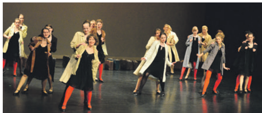
Das Tanzstudio Wendisch gastiert im Juni drei Mal im großen Haus des Theaters.

1. Juni, 17.00 Uhr im großen Haus (Premiere) sowie am 2. Juni und 15. Juni, jeweils 17.00 Uhr