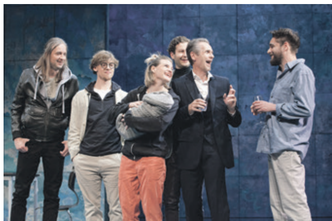
Das Bautzener Ensemble gastiert u.a. mit „Ein Volksfeind“ beim 12. Sächsischen Theatertreffen in Leipzig.