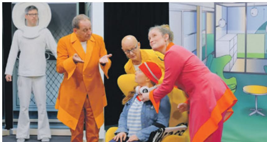
Mit ihren Freunden meistert sie schwierige Herausforderungen und geht schließlich gestärkt aus den Abenteuern hervor.

Gastspiel: 14. Mai, 9.05 und 10.50 Uhr im großen Haus