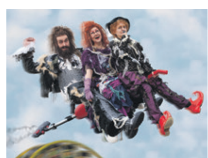
Freuen Sie sich mit uns auf den 28. Bautzener Theatersommer: Spuk unterm Riesenrad – Jetzt ist Bautzen dran!

oder telefonisch unter 03591 200910 bei Der Mittelstand. BVMW – Team Bautzen