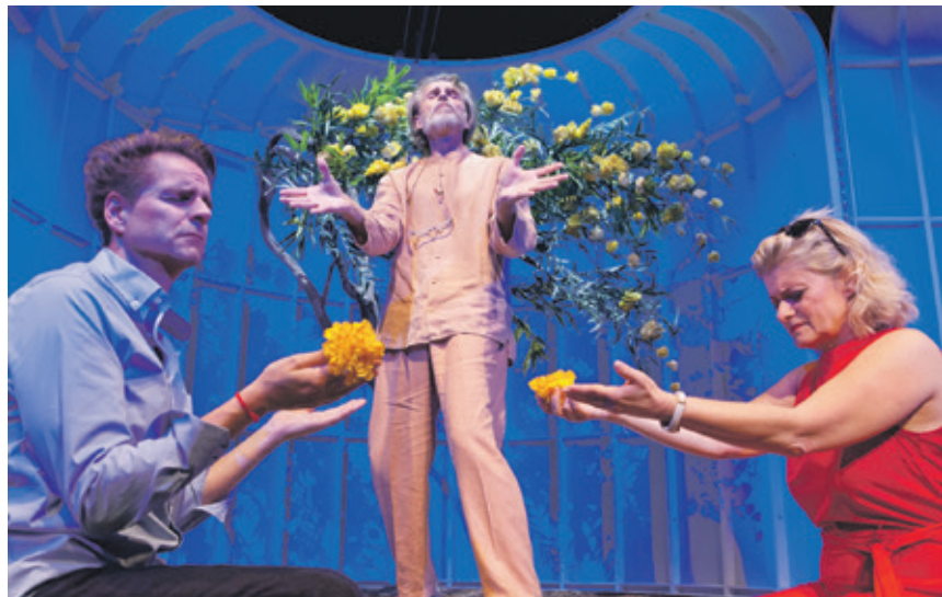
Die beste Therapie gegen die Widrigkeiten des Lebens ist ein herzerfrischendes und kollektives Lachen!

Vorstellungen: 4. Mai, 19.30 Uhr im Burgtheater 12. Mai, 15.00 Uhr im Burgtheater mit kostenloser Kinderbetreuung