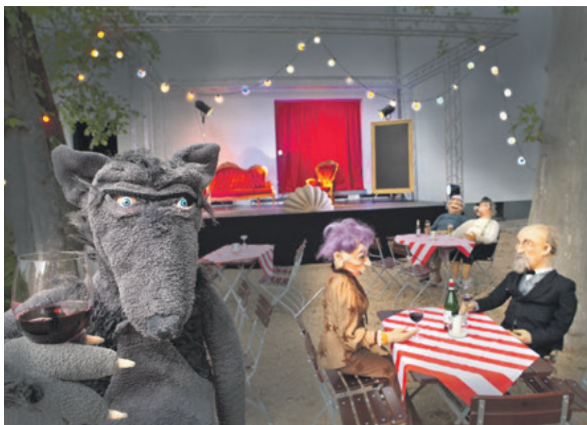
Unter romantischen Platanen wird es auch in diesem Jahr im Theatergarten am großen Haus für Junge und Junggebliebene ein breites Angebot an Theatervorstellungen geben.

Ergänzt wird der Erwachsenenenspielplan um ein neues, stimmungsvolles Programm: In „Lieder in den Abendhimmel“ (am 8. und 22. Juni, jeweils 19.30 Uhr ) wird die Inszenierung „Im Land der Däm-