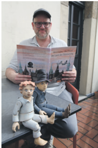
Der Leiter des Puppentheaters und Regisseur des Stückes hat sich zu einem fiktiven Gespräch mit Astrid Lindgren getroffen. Mit dabei waren auch die beiden Protagonisten des Stückes, Göran und Herr Lilienstengel.