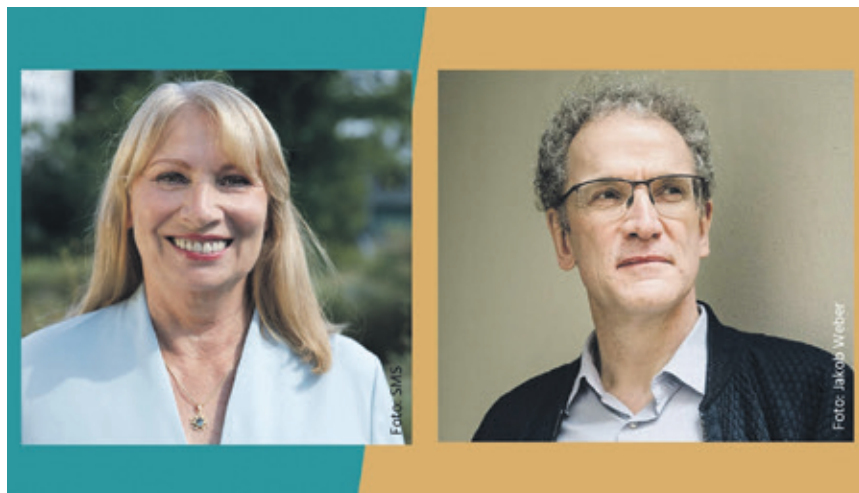
Die Lesung ist eine Veranstaltung der Friedrich-Ebert-Stiftung, Landesbüro Sachsen.