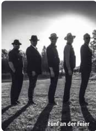
Fünf an der Feier